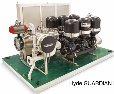
Hyde GUARDIAN HG250S