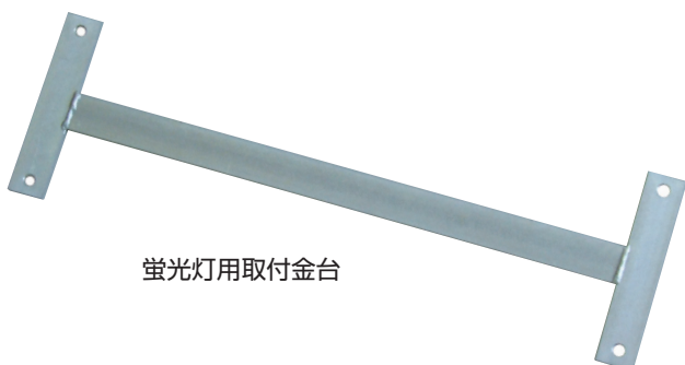
蛍光灯用取付金台